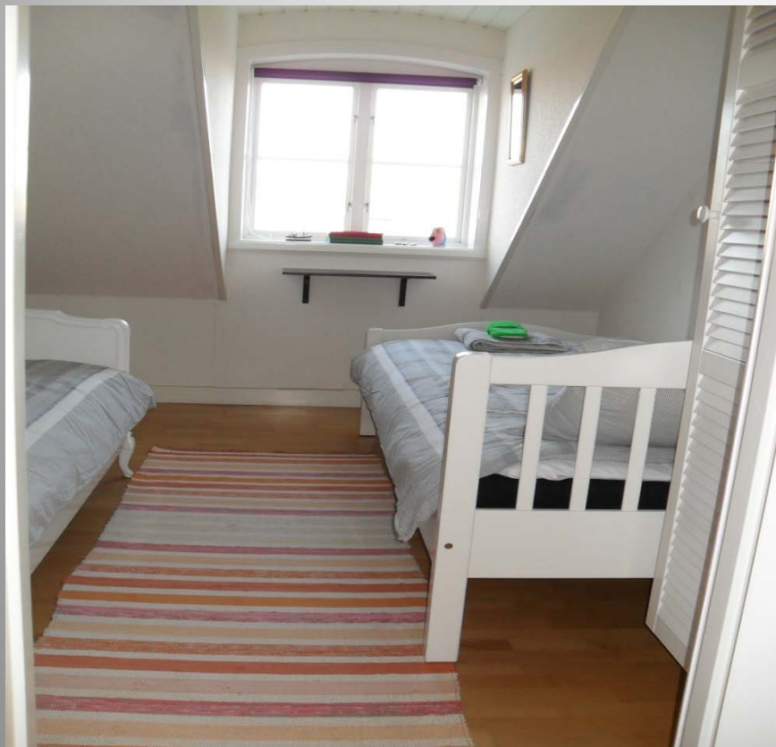
Sovrum nr 3