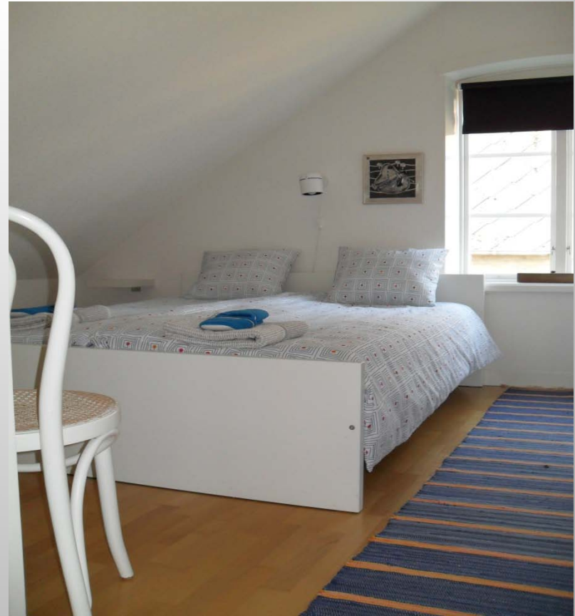
Sovrum nr 2